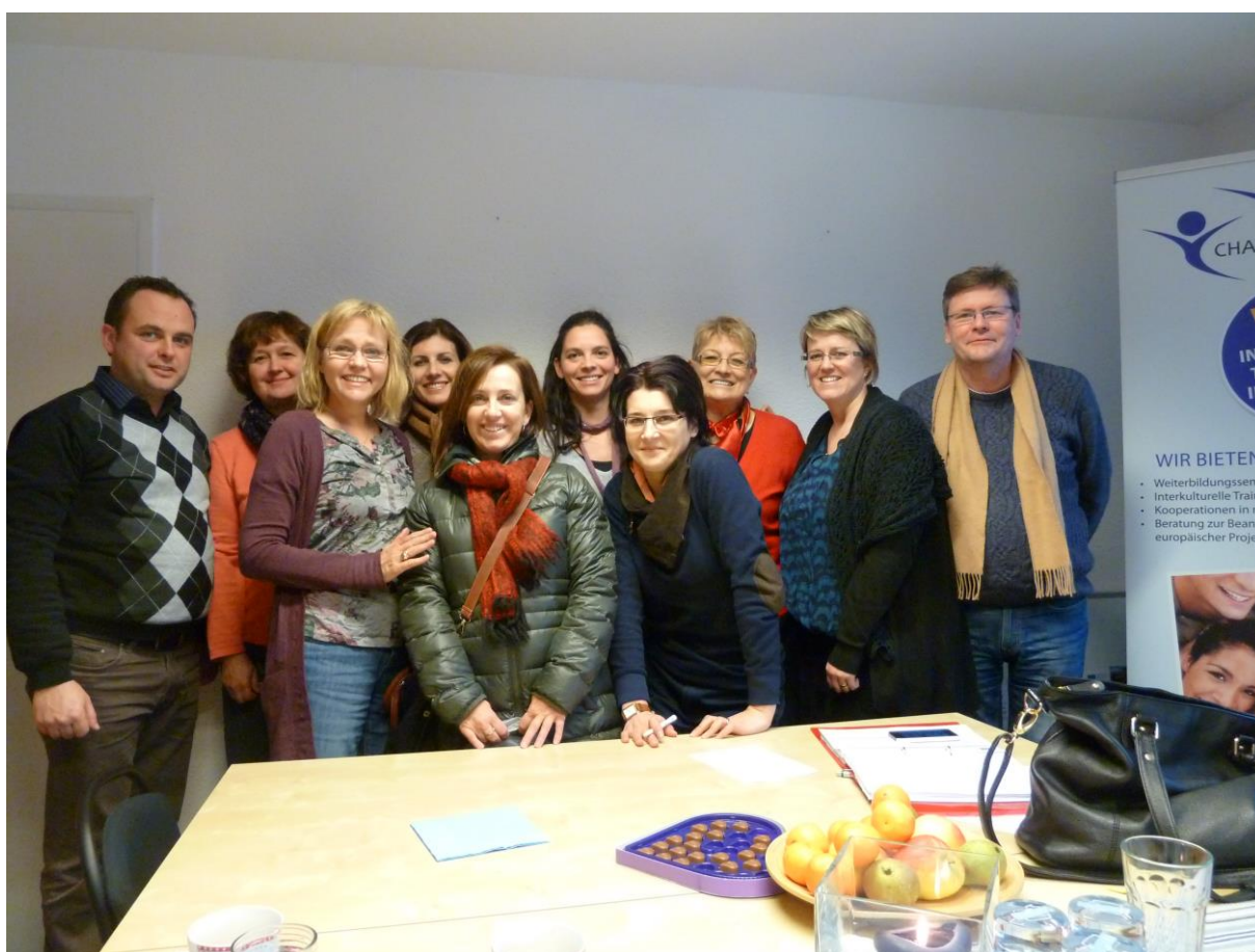
Reunión inaugural de los socios en Dortmund, Alemania.

La primera reunió dels socis va tindre lloc en la seu de CHANCENGLEICH in Europa i.V., la institució coordinadora, al desembre de 2014. En el meeting es tractaren els objectius del projecte, el calendari de treball i l'assignació de tasques a cada soci.