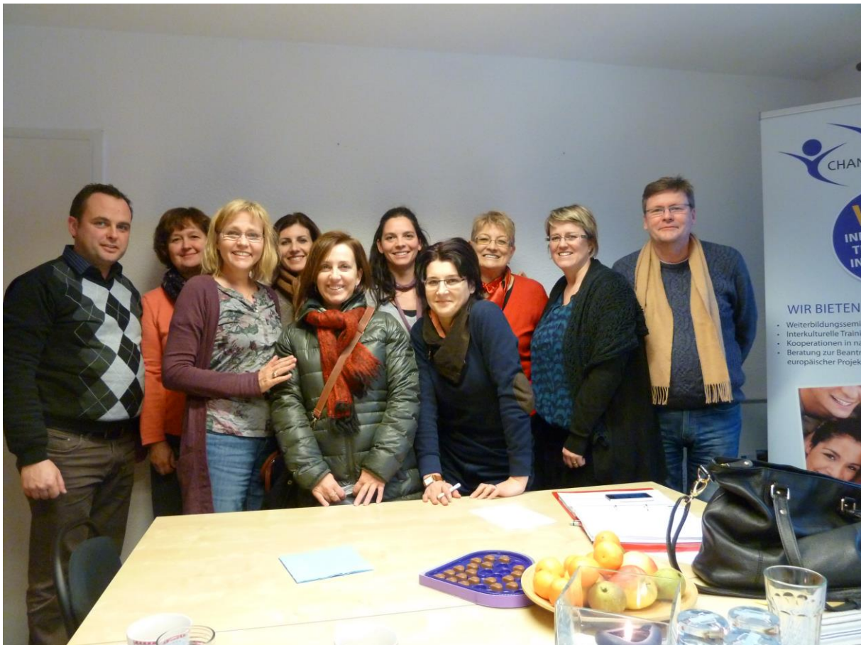
Reunión inaugural de los socios en Dortmund, Alemania.

La primera reunión de los socios tuvo lugar en la sede de CHANCENGLEICH in Europa e.V., la institución coordinadora, en diciembre de 2014. En el meeting tratamos los objetivos del proyecto, el calendario de trabajo y la asignación de tareas a cada socio.